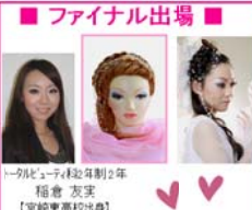
【受賞】2011年開催の「パリオートチュールコレクションへの参加」...

「H&M 第4回 パリコレ ヘア&メイクアップアーティスト オーディション」が開催されました。