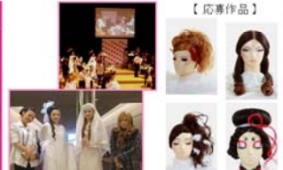
【受賞】2011年開催の「パリオートチュールコレクションへの参加」...