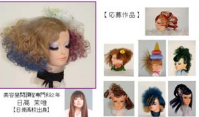
【受賞】2011年開催の「パリオートチュールコレクションへの参加」...

レジーナ主催の「第7回 2010 ヘア&メイクアップ Regine Photo Competition」が今年も行われました。