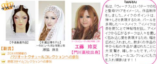
【受賞】2011年開催の「パリオートチュールコレクションへの参加」...

「H&M 第4回 パリコレ ヘア&メイクアップアーティスト オーディション」が開催されました。